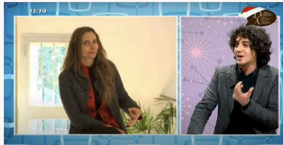
TRC Detto tra noi