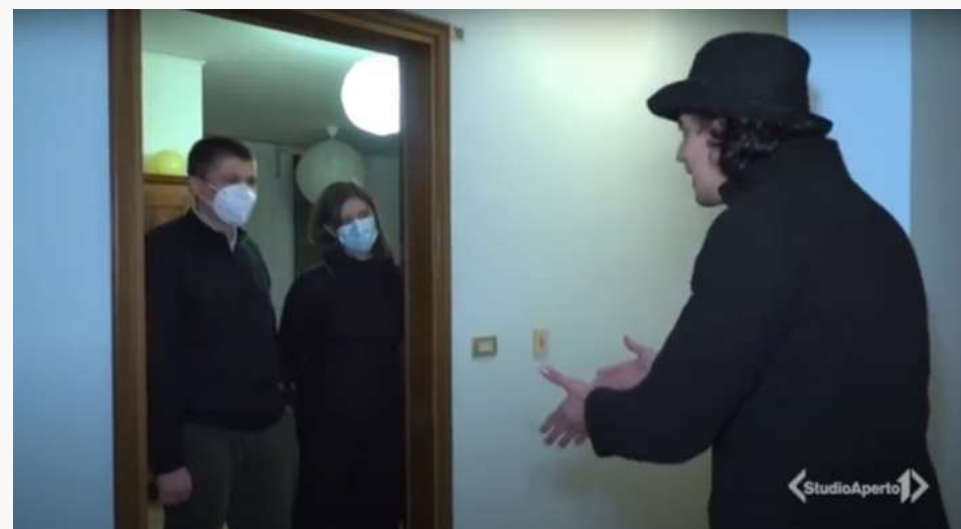
ITALIA1 Studio Aperto